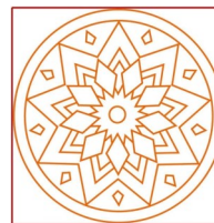
Padma Yoga LA